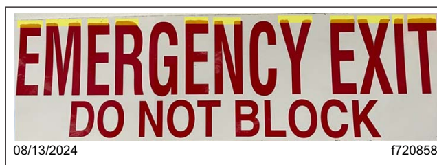
Fig. 4, Les zones surlignées indiquent des lettres nécessitant de la peinture

4.2 Figure 4 montre les zones surlignées qui ont besoin de plus de peinture sur les lettres.