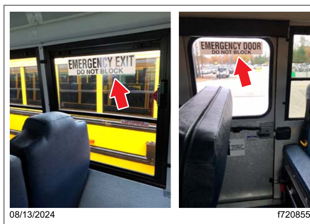
Fig. 1, Étiquettes de porte et de fenêtre d'urgence